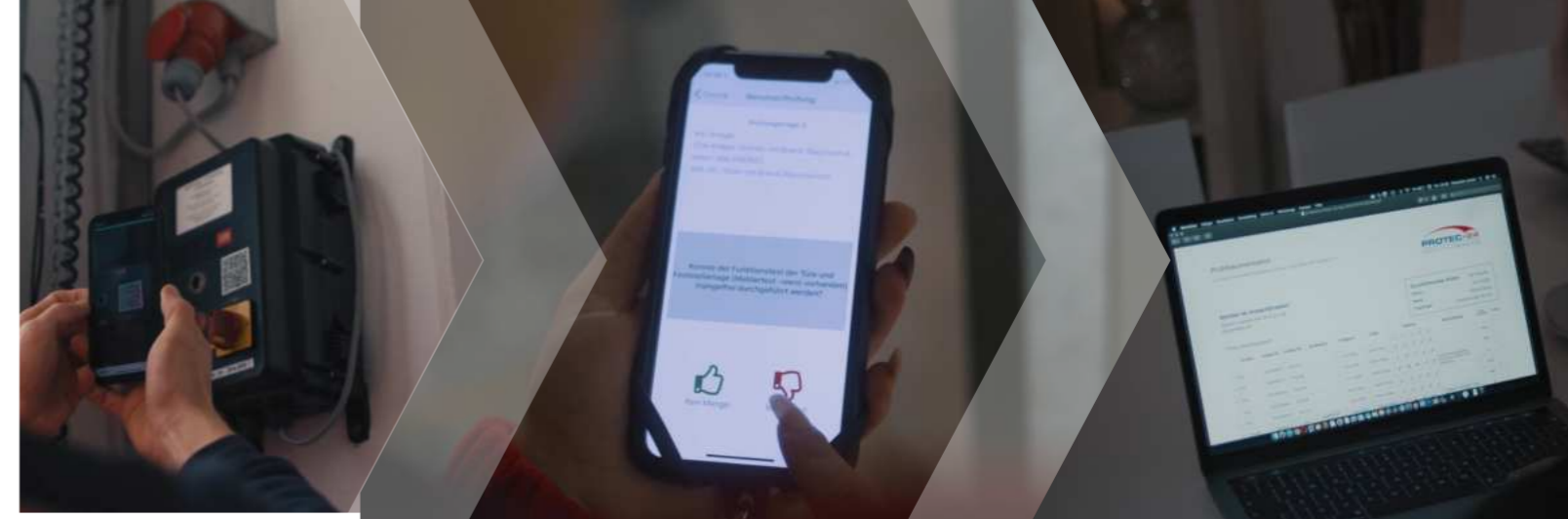
Scannen der Anlagen mit QR-Code

Gemäß den Unfallverhütungsvorschriften (UUV) und den Bauordnungen der Länder ist ausschließlich der Eigentümer bzw. der Betreiber einer Immobilie für die Sicherheit aller Mitarbeiter und Besucher verantwortlich. Damit liegt die Gewährleistung der Funktionsfähigkeit von Sicherheitseinrichtungen, wie z. B. Brandschutzanlagen ebenfalls beim Betreiber. In diesem Zusammenhang müssen beispielweise an Feststellanlagen monatlich bzw. vierteljährlich Betreiberprüfungen durch „Eingewiesene Person für Feststellanlagen“ vorgenommen werden.